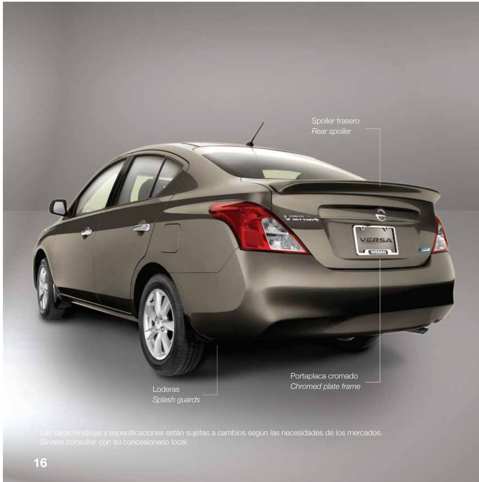
Spoiler trasero Rear spoiler