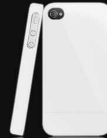
Blanco/ White QM1