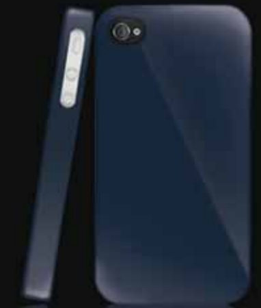
Azul Onyx/ Blue Onyx B23