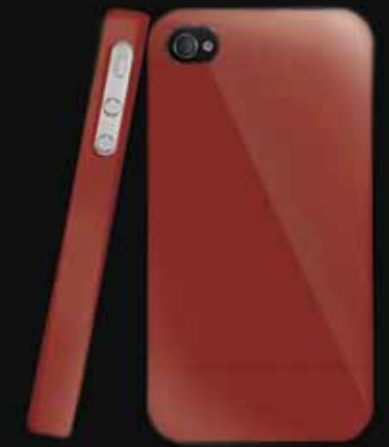
Rojo/ Red NAC

* Features and specifications are subject to change depending on market needs. Please consult your local dealer.