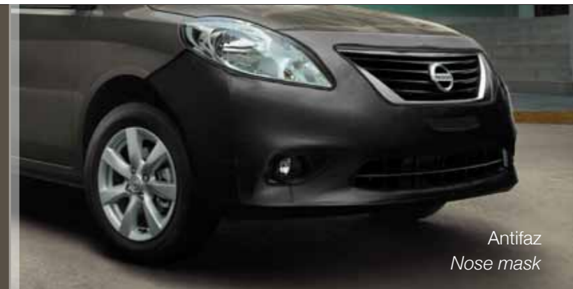
Antifaz Nose mask

* Features and specifications are subject to change depending on market needs. Please consult your local dealer.