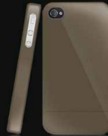
Titanio/ Titanium KAC