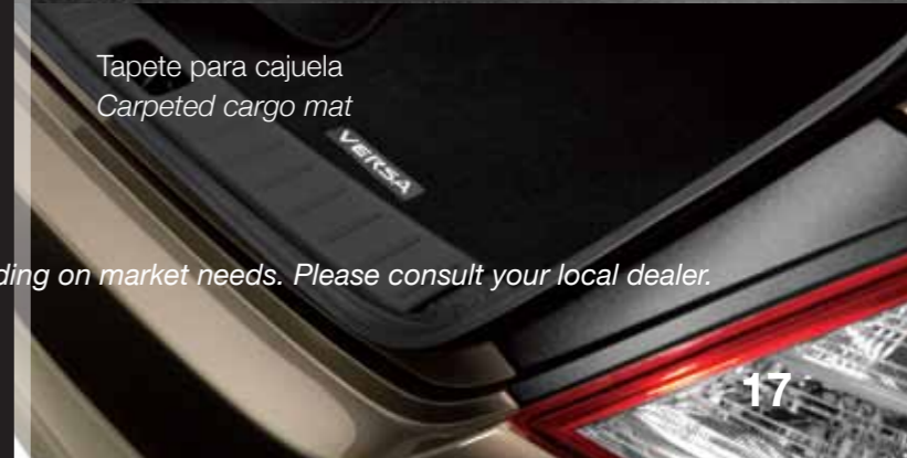
Tapete para cajuela Carpeted cargo mat