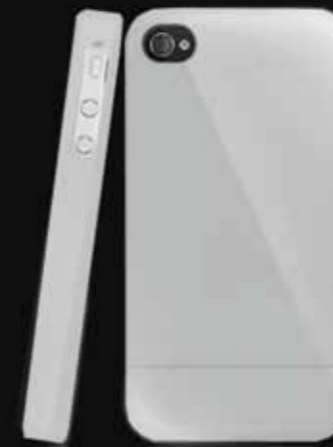
Plata/ Brilliant Silver K23