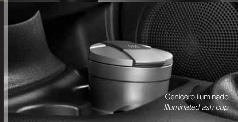
Cenicero iluminado Illuminated ash cup