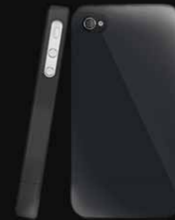
Negro/ Super Black KH3